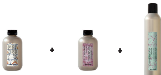
MEDIUM HOLD MODELING GEL CURL BUILDING SERUM STRONG HAIRSPRAY

Påfør i et håndklædetørt hår en lille mængde af medium hold modeling gel blandet sammen med curl building serum . Føntør herefter håret med en rundbørste eller en diffuser. Afslut stylingen med strong hairspray .